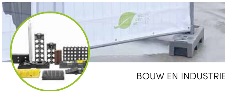
BOUW EN INDUSTRIE

Niet ieder type kunststof is geschikt voor een recyclage in rechte lijn tot een nieuwe pallet, box of afvalcontainer. Toch bieden onze gecertificeerde partners met hun betrouwbare knowhow ook hiervoor tal van gekende en minder gekende mogelijkheden met gebruik van diverse post-consumer mengresten, PET- en PVC-recyclagestoffen.