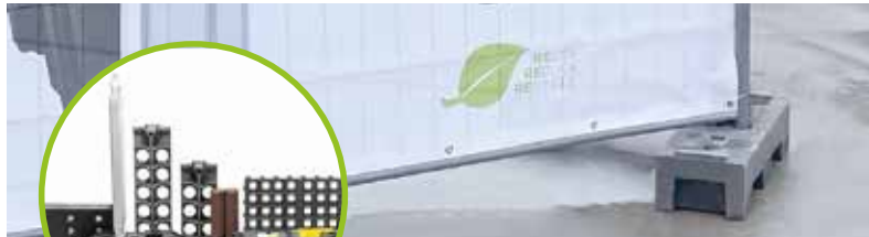
CONSTRUKTION UND INDUSTRIE

Nicht jeder Kunststofftyp eignet sich für ein geradliniges Recycling in neue Paletten, Kisten oder Abfallbehälter. Dennoch bieten unsere zertifizierten Recyclingpartner mit ihrem verlässlichen Know-how viele bekannte und weniger bekannte Möglichkeiten dafür mit der Verwendung verschiedener Post-Consumer-Mischrückstände, PET- und PVC-Recyclate.